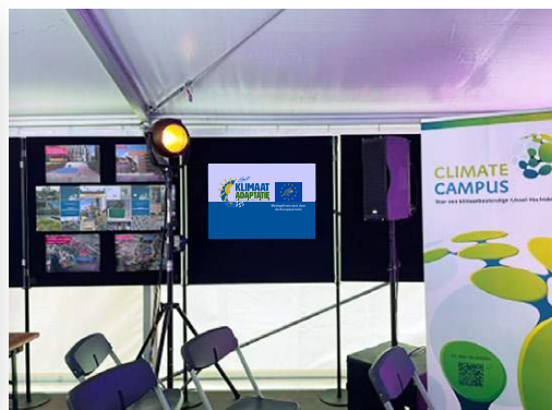
Voorbeeld van het gebruik van een poster, op 23 september 2022, tijdens een openbare bijeenkomst van de Climate Campus in Zwolle