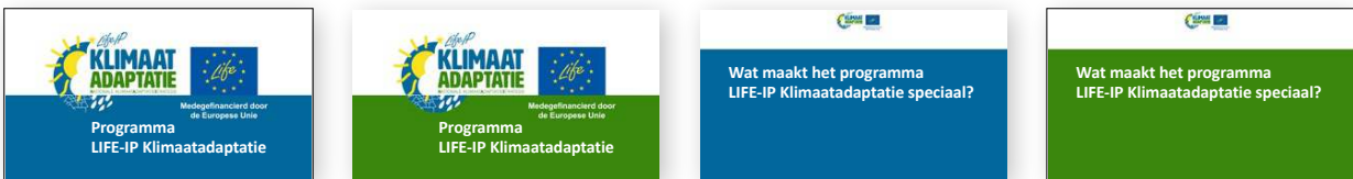
Voorbeelden van slides in een PowerPoint-presentatie te vinden op deze website