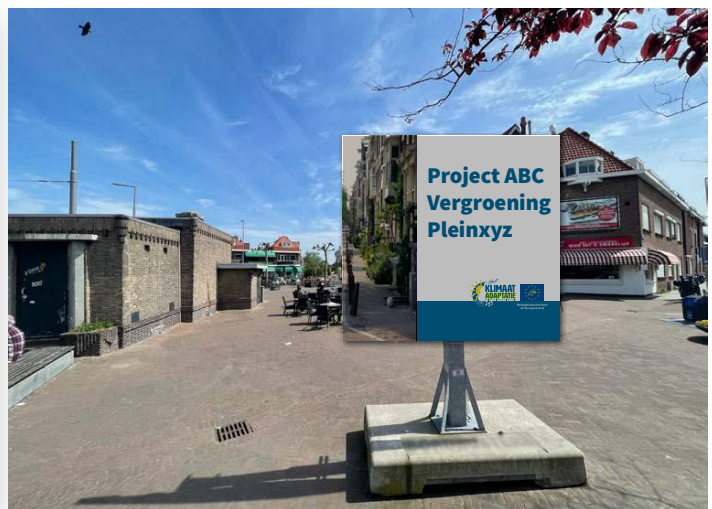
Voorbeeld van het gebruik van een informatiebord