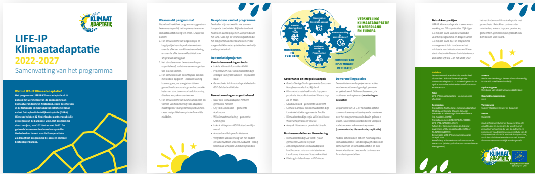
Voorbeeld van een folder (staat ook op het Kennisportaal Klimaatadaptatie)