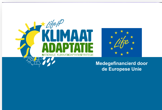
Voorbeeld van een poster