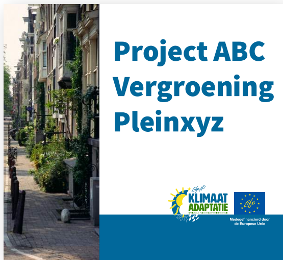
Voorbeeld van een informatiebord